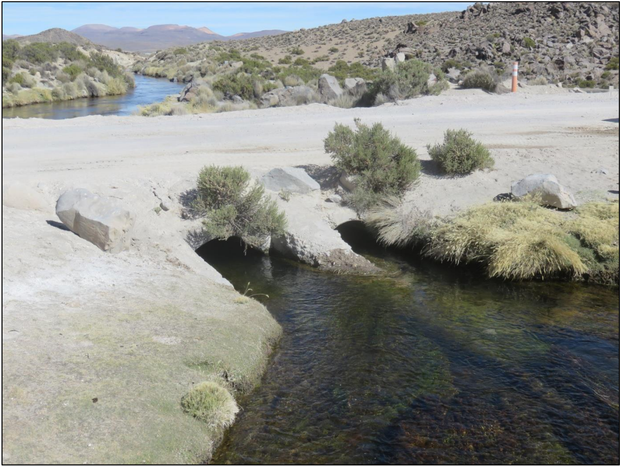
Imagen 2. Sector de extracción, río Lauca. Vista este. Aguas arriba.