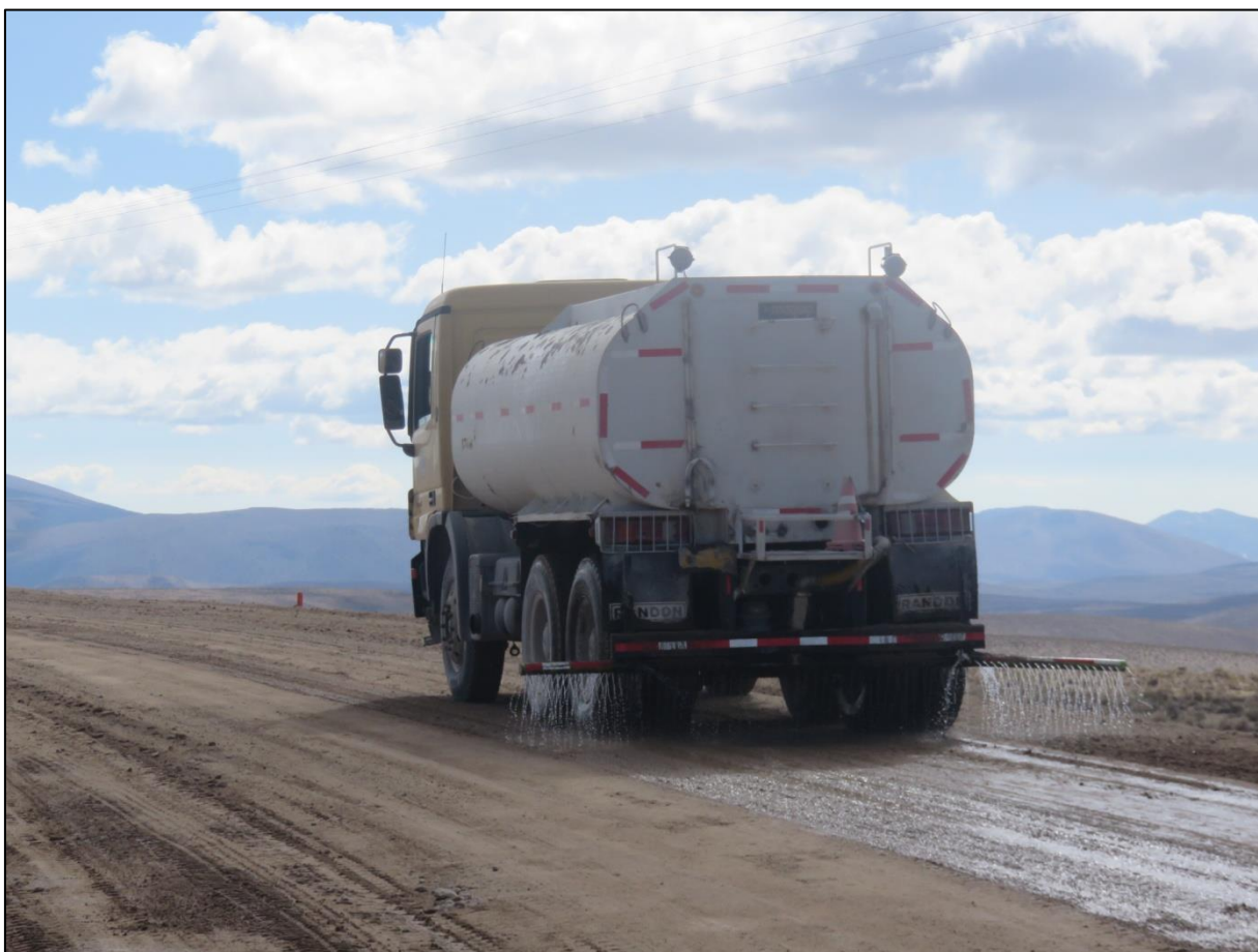
Imagen 1. Camión aljibe en proceso de humectación de ruta.

Camión Mercedes Benz, año 2005, placa patente XU 9925, modelo 3335 K, de 12.000 litros de capacidad. Se anexa documentación al día del vehículo.