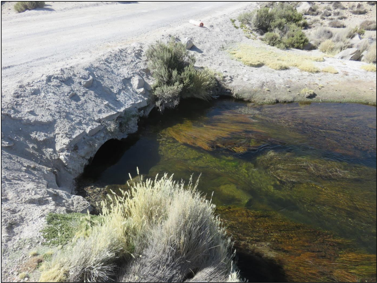
Imagen 3. Sector río Lauca. Vista oeste. Aguas abajo.