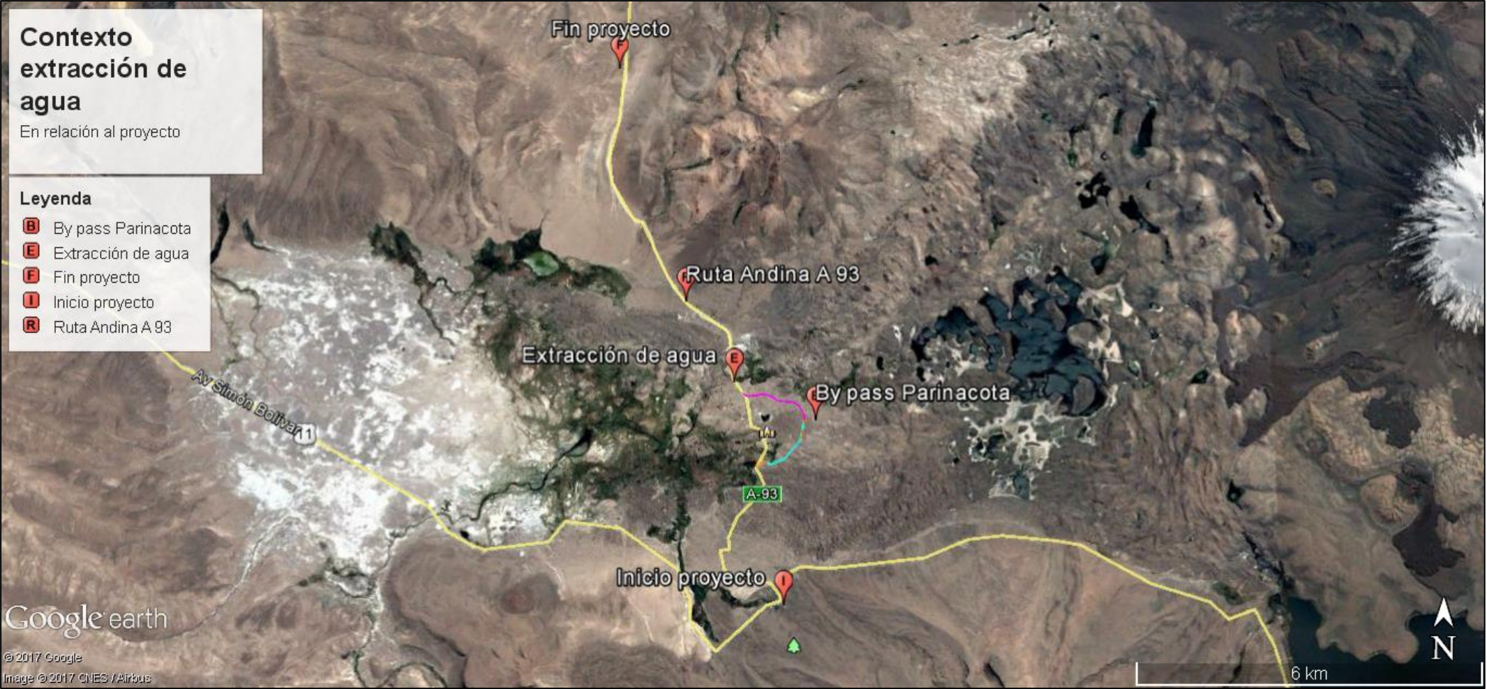
Imagen 4. Sector en donde se realiza el proyecto. Región de Arica y Parinacota, comuna de Putre.